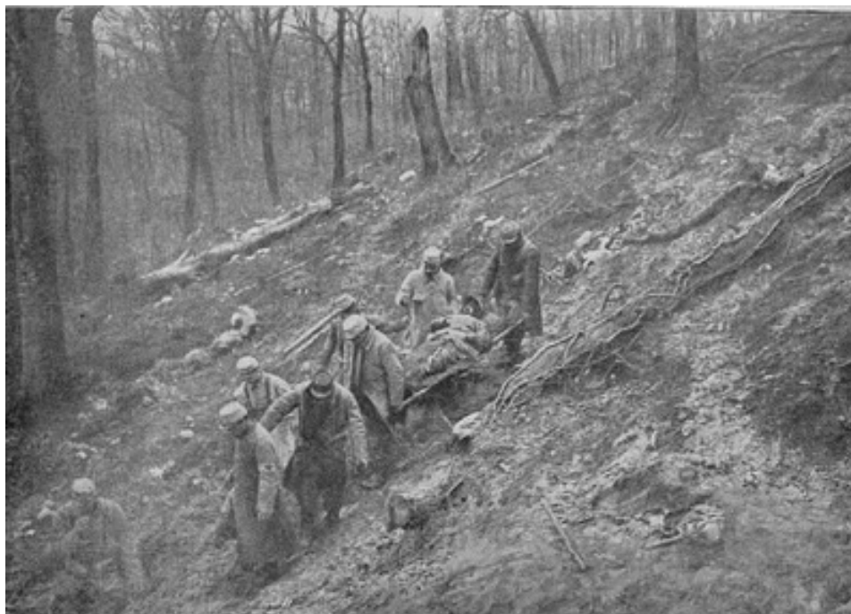
Le transport des blessés sur les pentes boisées du ravin des Eparges 15